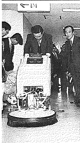
実技 自動洗浄機による転倒防止剥離作業 蔵王産業(株)デモ機使用

長が開発されたハクリ剤の説明があった。従来のハクリ剤では、粘度が強く、泡立ち、自動床洗浄機を使用するの剥離作業に難があったが、新製品ではこれを解消し、またISO-14000シリーズに対応した環境に優しいコンセプトに基づく商品となっている。